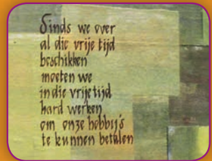
Greet Soete Kalligrafie