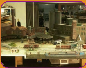
Ives Regent Koffertrein