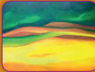
Walter Opstaele Schilderkunst (Acrylverf)